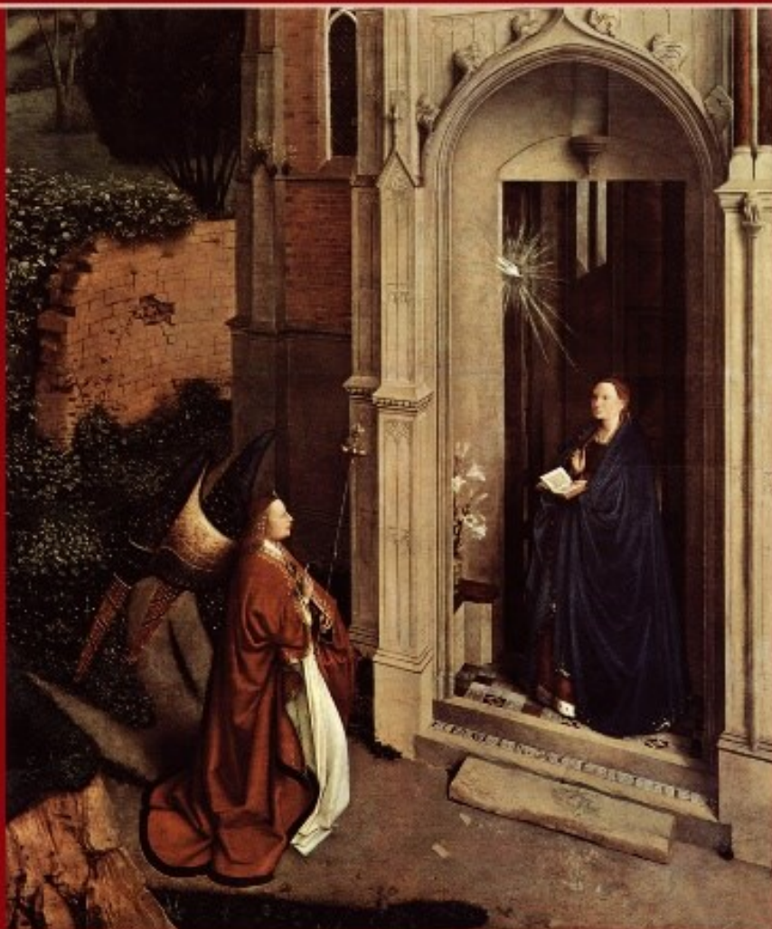
Ян ван Эйк «Благовещение»